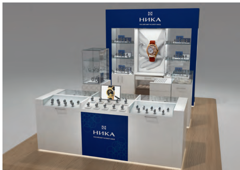
Остров 10-16 м 2

Размещение: 1 этаж крупного ТЦ в зоне с высокой проходимостью