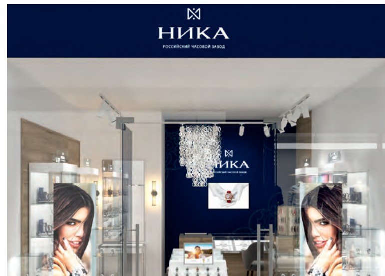
Малый салон 17-25 м 2